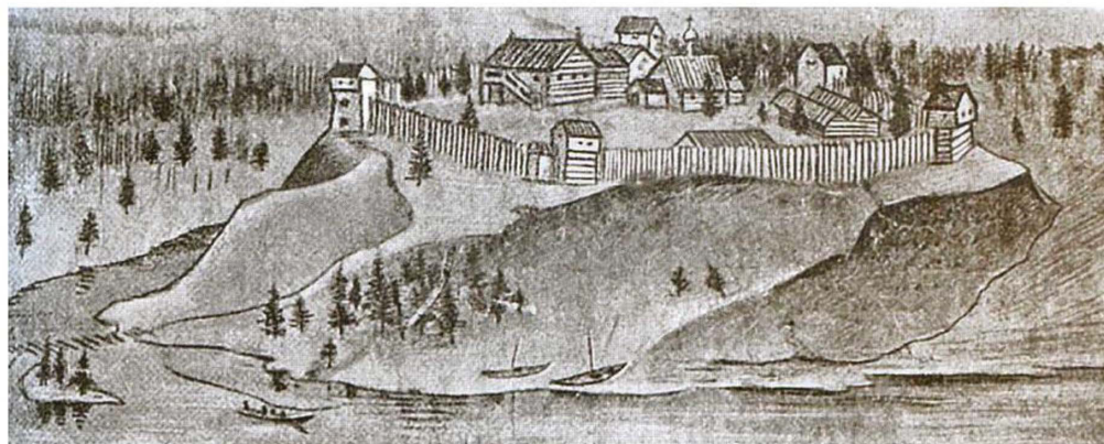
Рис. 2. Первый костромский кремль. XVII в. [Лебедев: 29]

Возникает естественный вопрос, какой вид имела Кострома того времени? К сожалению, ни письменных, ни археологических 7 данных об этом