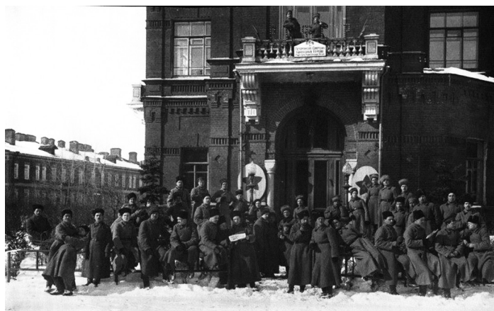
Рис. 4. Курсанты петергофских командных курсов на территории военного городка. 1919 г. 12

Сообразно этим положениям и на основании приказа Наркомвоена РСФСР № 130 от 14 февраля 1918 г. на территории городка формируются 1-е Ораниенба-