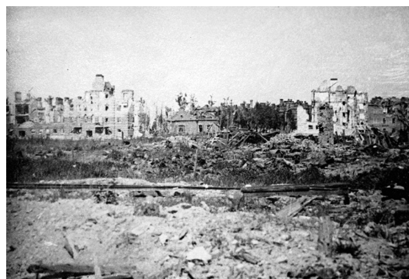
Рис. 8. Разрушения в 7-м военном городке. 1944 г. 27

ружейно-пулемётному огню, вследствие чего была практически полностью разрушена. За время боёв сохранились остовы и развалины едва ли 10–15 сооружений (казарм, домов офицеров, офицерского собрания и манежа) 22 (рис. 8).