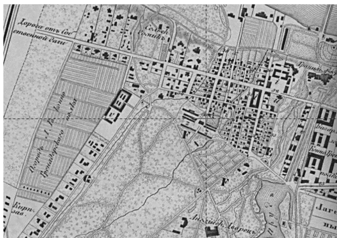
Рис. 1. Местность военного городка на карте 1868 г. 1