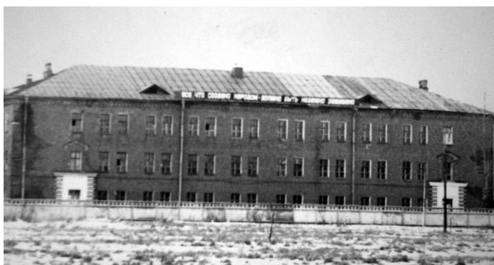
Рис. 11. Одна из казарм 30 оуждп и ЛВУ ЖДВ и ВОСО (ныне - СпбКВК). Начало 1980-х гг. 33

ной инфраструктуры и народного хозяйства оккупированных территорий 7-й военный городок в г. Петродворец (город переименован в 1944 г.) становится объектом подчинения железнодорожных войск. Возрождение городка из руин было начато в конце 1940-х – начале 1950-х гг. силами подразделений 10-й отдельной железнодорожной бригады, оперировавшими на ораниенбаумском железнодорожном направлении [Когатько: 12, 30–32].