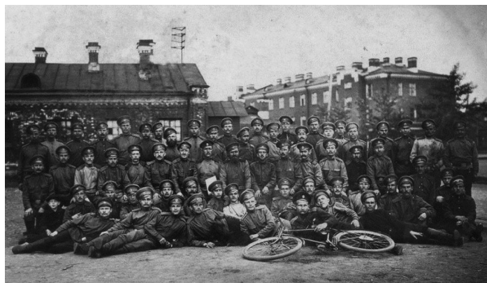
Рис. 3. Нижние чины 2-го сводно-гвардейского запасного батальона у цейхгауза военного городка, 1916 г. 9

ских отделений конского запаса 8 . Эти запасные части осуществляли восполнение убыли лошадей для действующей армии, поэтому их дислокация на территории кавалерийского полка представляется весьма закономерной. В это же самое время в городке формируется 2-й сводно-гвардейский запасный батальон. Данный исторический факт удалось установить, в частности, благодаря изучению документов личного характера его чинов и членов их семей (рис. 3).