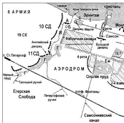
Рис. 7. Линия фронта в Петергофе вблизи 7-го военного городка. Октябрь 1941 г. 26

С началом Великой Отечественной войны к Петергофу стягивались отступающие из Прибалтики различные воинские формирования РККА, а сам город становится ареной ожесточённых боёв. К 23 сентября 1941 г. немецкие части захватывают Новый Петергоф. Линия фронта в этом районе проходила по Английскому парку и далее по Троицкому ручью к Финскому заливу (рис. 7). Старый Петергоф и 7-й военный городок, ставшие восточной оконечностью Ораниенбаумского плацдарма, оставались под контролем советских войск на протяжении всей войны 21 . Однако территория городка фактически соприкасалась с передовыми позициями, как в Английском парке, так и возле железнодорожной станции Старый Петергоф. Поэтому она подвергалась мощным авиационным и артиллерийским ударам, а также