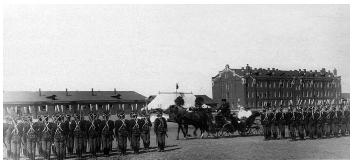
Рис. 2. Торжественное построение чинов лейб-гвардии Драгунского полка в военном городке по случаю прибытия шефа полка, 1910-е гг. 4

Русско-турецкой войны 1877–1878 гг. [Маркитанов: 74–76]. Для расквартирования полка в период 1900–1902 гг. на участке, обозначенном на карте Петергофа 1868 г. (рис. 1) как огород лейб-гвардии Конно-гренадерского полка, производится строительство нового военного городка со всей необходимой инфраструктурой (казармами, манежем, учебным полем, полковым храмом и т. д.) 2 .