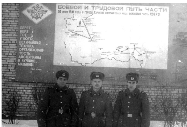
Рис. 9. Солдаты 30 оуждп у стенда истории полка. Конец 1970-х гг. 31