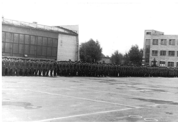
Рис. 10. Личный состав ЛВУ ЖДВ и ВОСО на плацу городка. Начало 1980-х гг. 32