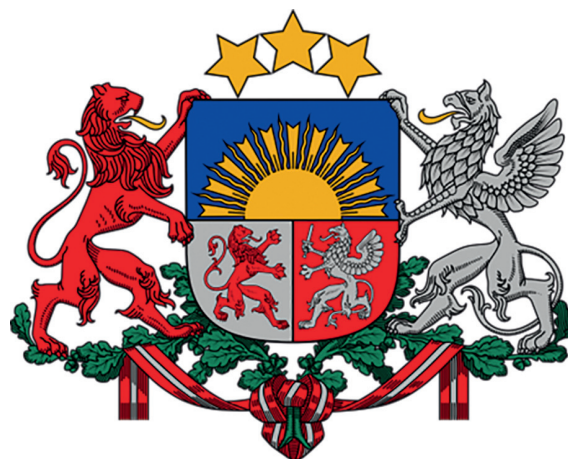
Рис. 2. Герб Латвийской Республики

Восходящее солнце в верхней половине геральдического щита символизирует национальную государственность Латвии. Стилизованные изображения солнца как знака национальной принадлежности использовались латышскими стрелками во время Первой мировой войны, в которой они принимали участие в составе русской армии. В эмблеме, которая как государственный символ использовалась