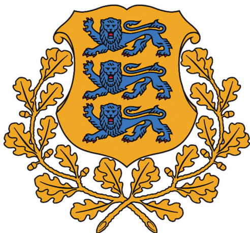
Рис. 1. Герб Эстонской Республики

хвативший северную Эстонию во время крестовых походов, пожаловал городу Таллину герб с тремя львами (в геральдике – леопардами), похожий на герб собственного (датского) королевства. Этот же мотив был позднее перенесён на герб Эстляндской губернии, утвержденный императрицей Екатериной II 4 октября 1788 г. Современный вид эстонский герб (см. рис. 1) приобрёл 19 июня 1925 г. с принятием соответствующего закона, а восстановлен был после длительного перерыва (период существования Эстонской ССР) 7 августа 1990 г. [Символы]. При этом эстонский геральдический знак, как и любой другой, имеет свою символическую структуру, связанную с конкретными историческими событиями в стране, и трактуется следующим образом: один лев обозначает храбрость и мужество эстонцев в борьбе за независимость в древние времена; другой – отвагу и мужество в крестьянской войне 1343–1345 гг. против германо-датского ига; третий – борьбу за свободу в 1918–1920 гг.